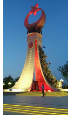
15 Temmuz Şehitleri Anıtı

Ülkemiz; 15 Temmuz 2016 tarihinde milletimizin birlik ve beraberliğine, demokratik düzenimize, hukukun üstünlüğüne ve milli iradeye yönelik tarihin kaydettiği en büyük ihanet girişimine, menfur bir kalkışmaya maruz kalmıştır. Yüce milletimiz, ülkemizin bölünmez bütünlüğü ile milletimizin birlik ve beraberliğinin anayasal güvencesi olan demokratik düzenimize ve milli iradeye tarihte eşî görülmemiş cesaret ve kararlılıkla canını ortaya koyarak büyük bir özveriyle sahip çıkmıştır. Ülkemizin birliği ve devletimizin bekası için canlarını feda ederek şehadet şerbetini içen aziz şehitlerimize Yüce Allah'tan rahmet diliyor, tüm şehit ve gazilerimize minnet ve şükranlarımızı sunuyoruz.